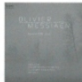
メシアン 前奏曲集 FOCD3454