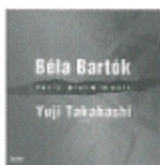
バルトーク 初期ピアノ作品集 FOCD9427