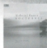
フォーレ 夜想曲集 FOCD3465