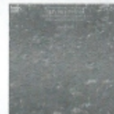
メシアン おさな亮イェズにそそぐ 20のまなざし* FOCD2712/3