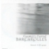
フォーレ 舟歌集 FOCD3487