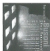
プーニ ソナティナ集 FOCD9347