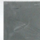
武満徹 鍵盤作品集** FOCD9228