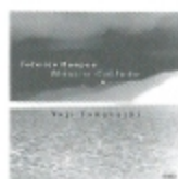
モンポウ 沈黙の音楽 FOCD9346