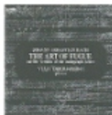
バッハ フーガの技法* 台座譜による初期稿 FOCD9074